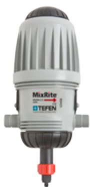
MixRite 2.5 0.8% (11 GPM)