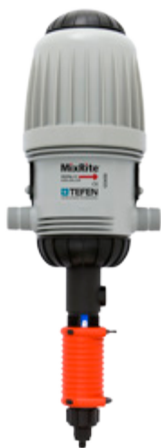
MixRite 2.5 PO (11 GPM)