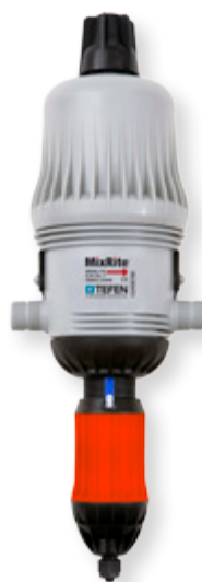
MixRite 3.5 PO (15.5 GPM)