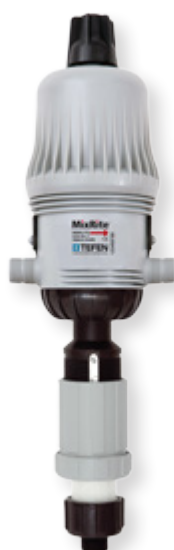
MixRite 3.5 1-10% (15.5 GPM)