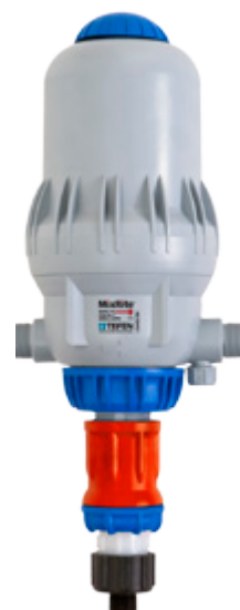
MixRite TF-5 (22 GPM)